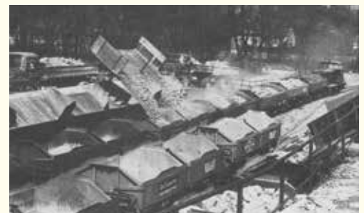
Hochbetrieb herrscht im Verladebahnhof am Hillenberg, wo der Kalkstein vom LKW in die Flachkipper der WLE verladen wird.

Wenn auch im Laufe der letzten Jahre durch die günstige Konjunktur auf dem Kalksteinmarkt wesentlich höhere Einnahmen erzielt werden konnten, so reichten dieselben bei weitem nicht aus, auch nur die laufenden Ausgaben an Zinsen usw. zu decken, geschweige denn eine Abschreibung bzw. Rückstellung vorzunehmen.“