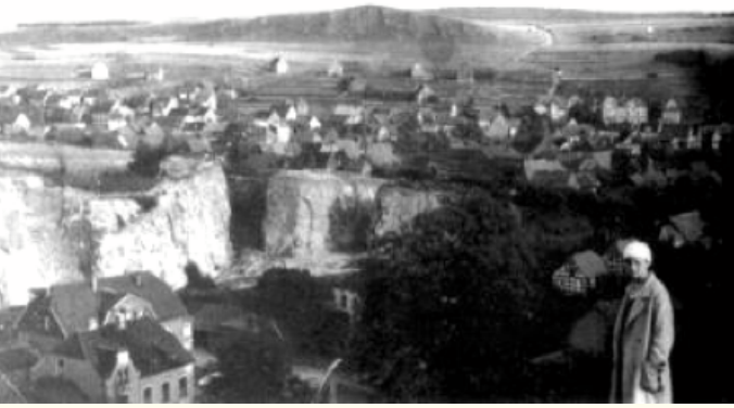
Bild 1: Felsendurchstiche im unteren Oberhagen für die Industriebahnen im Jahr 1929

Am 22. November 1881 wird die Warstein-Lippstädter Eisenbahngesellschaft (WLE) gegründet; am 1. November 1883 findet dann die Einweihungsfahrt von Lippstadt nach Warstein statt. Der Bahnbau wird auf Initiative heimischer Industrieller, die aufgrund einer fehlenden Eisenbahnanbindung einen zunehmenden Wettbewerbsnachteil befürchten, vorangetrieben. In der Folgezeit wird die Stammstrecke über Lippstadt hinaus bis Münster verlängert; daneben entstehen auch Strecken nach Soest und Brilon; außerdem betreibt die Bahngesellschaft auch noch von diesem Netz getrennte Linien. In den 1960er und 1970er Jahren schrumpft das Netz dann zusammen; zahlreiche Strecken werden stillgelegt und abgebaut, der Personenverkehr vollständig eingestellt. Nach wie vor bringt die WLE auf ihrer Stammstrecke Warstein - Münster und dem Abzweig nach Rüthen aber bedeutsame Verkehrsleistungen und ist seit fast 140 Jahren ein wichtiger Partner der heimischen Wirtschaft.